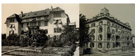
Die Bauten der Vorgängervereine Dankensberg (L.) und Blinden-Leuchtturm Zürich.

Vorgeschichte 1979 stellen der Verein Blindenheim Dankensberg und die Genossenschaft Blinden-Leuchtturm Zürich und ihre Betriebe ein und gründen gemeinsam die Stiftung Mühlehalde. Die Stiftung soll ein Heim für Blinde